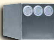
Alternative Ausgabereinheiten in verschiedenen Bautiefen