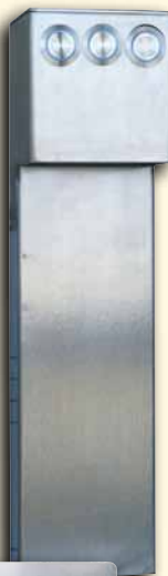
Tropfschale für den Einbau