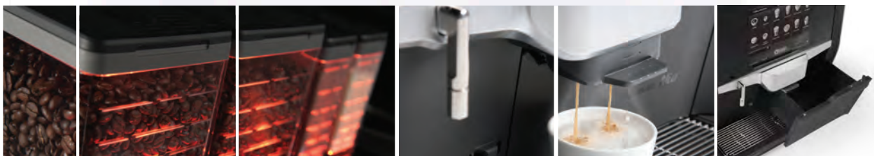
illuminated ingredient canisters