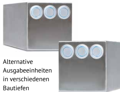
Alternative Ausgabeeinheiten in verschiedenen Bautiefen

SP PLUS MINI • MAXI • POWER ▶ Abmessungen (H x Ø Zapfkopf): 390 x 114 mm Ausschankhöhe: 262 mm