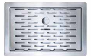
Tropfschale für den Einbau ▶