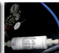
UltraFiltrierung 0,02 µ

Zur Verbesserung der Wasserqualität, insbesondere der Verhinderung von Verkeimungen empfehlen wir Ihnen unbedingt den Einsatz von Filtersystemen. Wir bieten Ihnen verschiedene Möglichkeiten, beispielsweise: